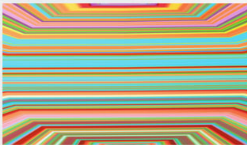
Bermuda 2005, stampa digitale su tela, dalla serie Strata Mandala di Linda Bradford.